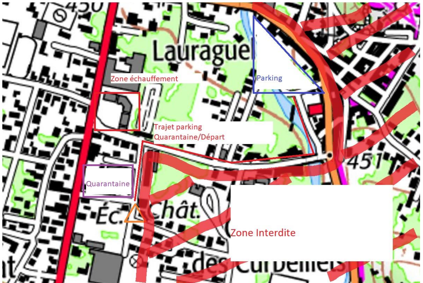
Plan 2: Zoom sur le parking, la zone de quarantaine et le départ