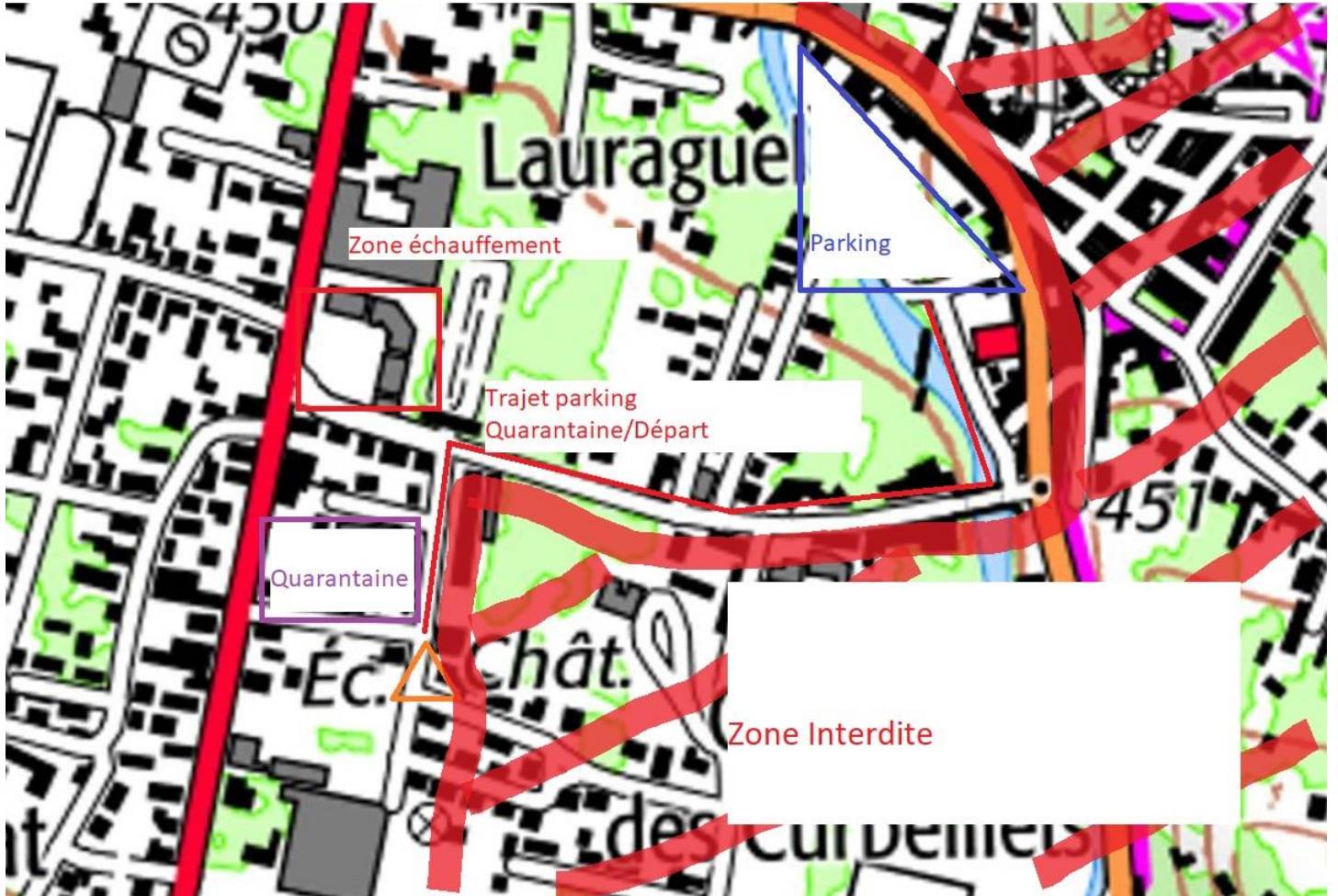
Plan 2: Zoom sur le parking, la zone de quarantaine et le départ